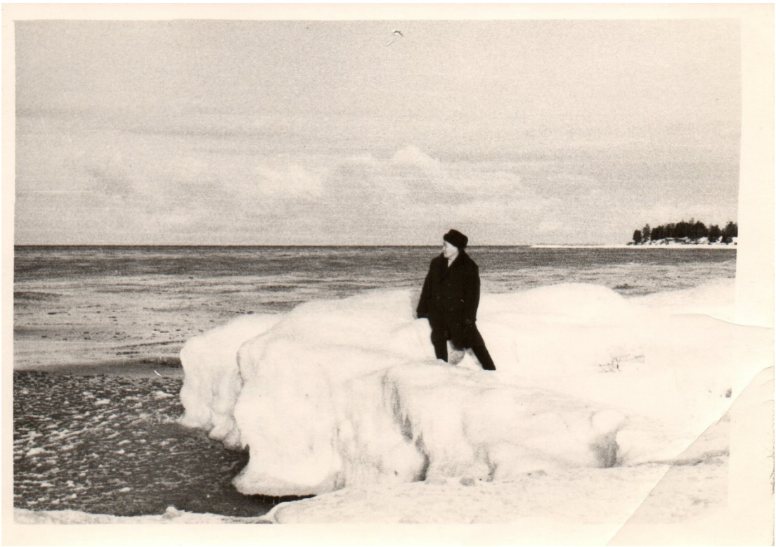
Зимой 1965 года на озере Байкал. сан. «Горячинск»