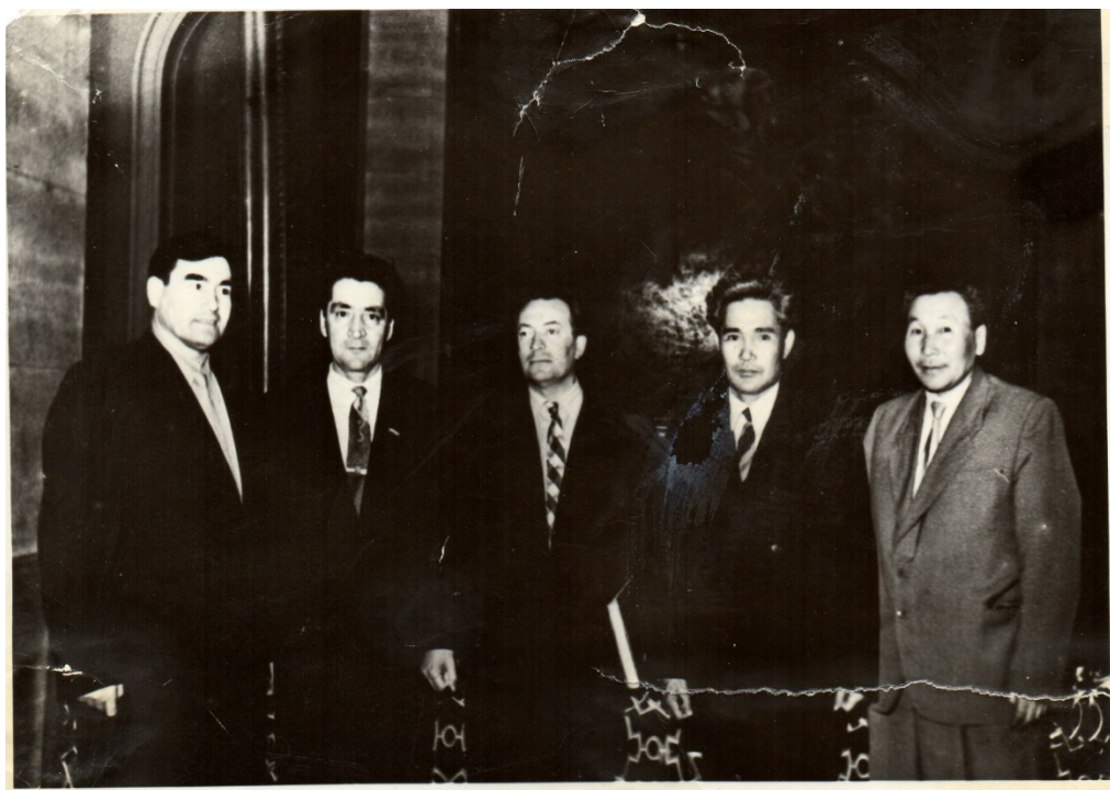
1958 год. Кремлевский дворец