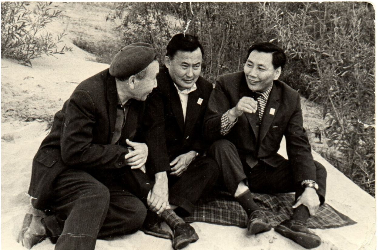
Беседа на берегу у Лены – реки, лето 1967 года