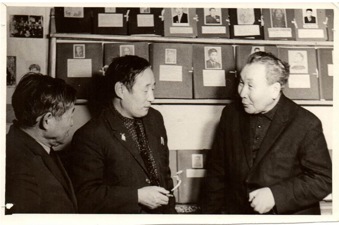
Усть – Алданский район с. Кэптэмэ: в литературном музее Афанасьева В.Ф. 1969 год.