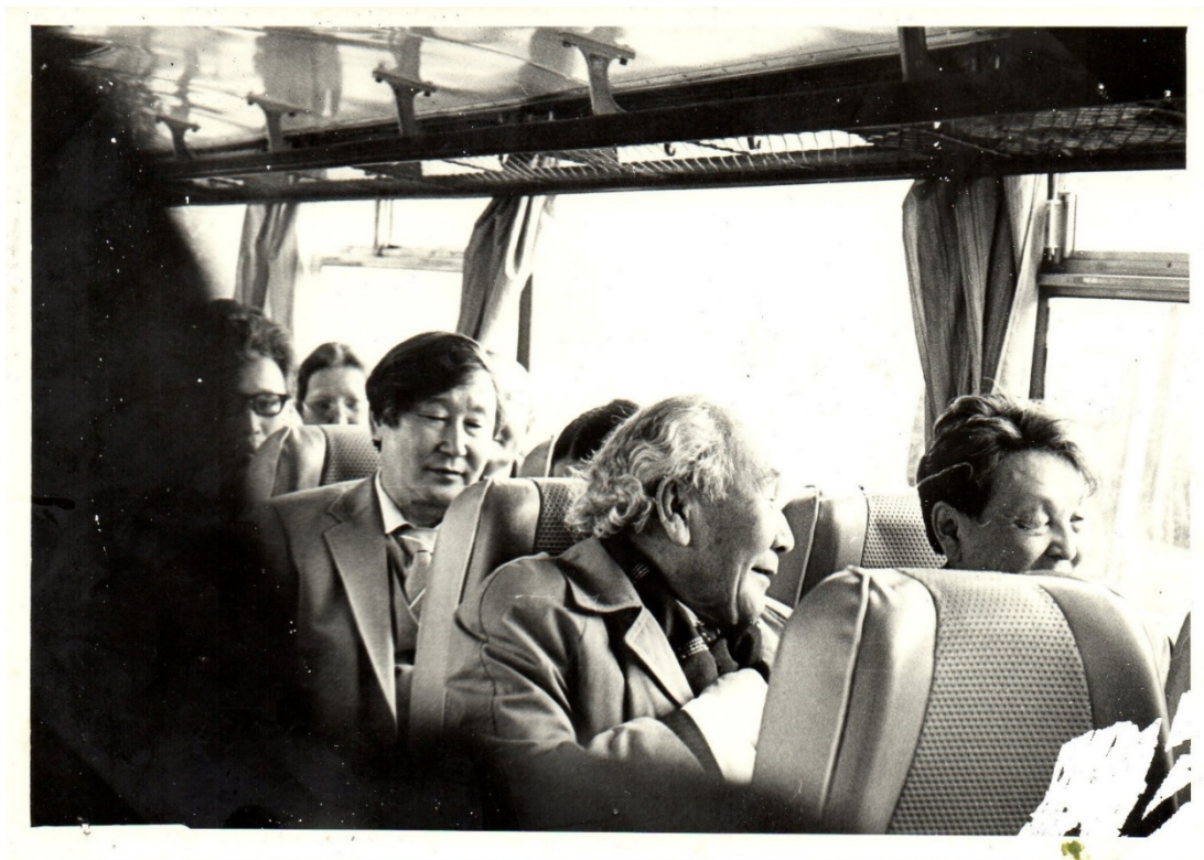
Вместе с якутскими писателями.