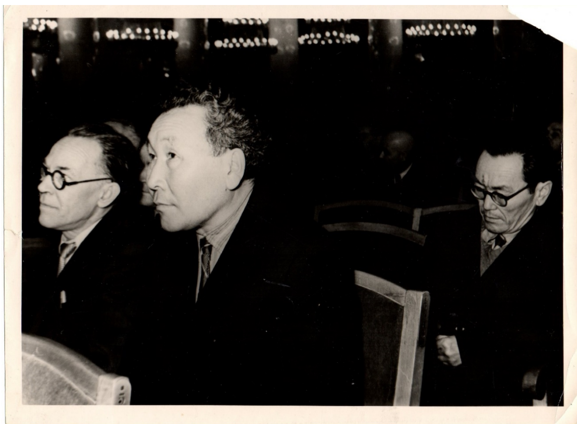
Москва, Дом Союзов «Колонный зал». Во время II съезда писателей РСФСР, 1963 год.